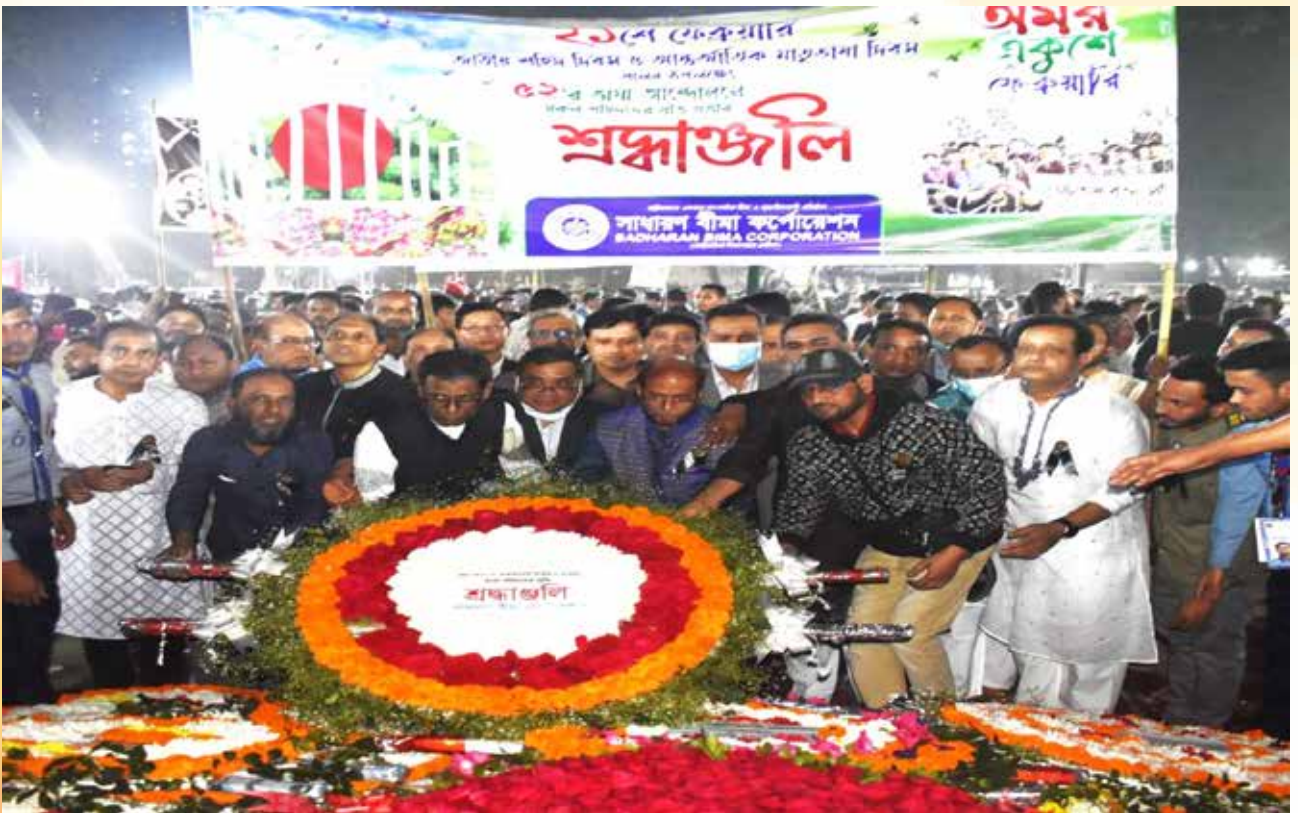
২১শে ফেব্রুয়ারি ২০২৪ শহীদ দিবস ও আন্তর্জাতিক মাতৃভাষা দিবস উপলক্ষ্যে ভাষা শহিদদের স্মরণে প্রথম প্রহরে কেন্দ্রীয় শহিদ মিনারে পুষ্পস্তবক অর্পণ করা হয়।