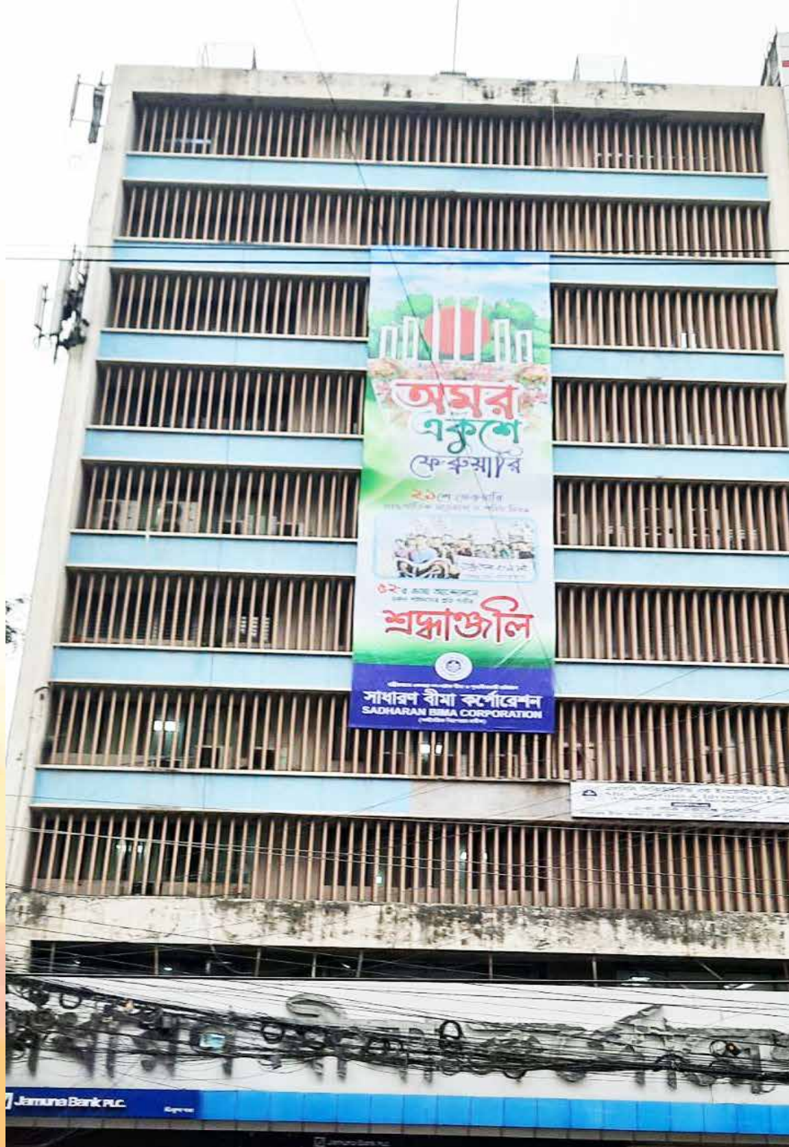
২১শে ফেব্রুয়ারি ২০২৪ শহিদ দিবস ও আন্তর্জাতিক মাতৃভাষা দিবস উপলক্ষ্যে সার্বিক, প্রধান কার্যালয়ে ড্রপ-ডাউন ব্যানার ও স্ট্যান্ড ব্যানার সাটানো হয়।