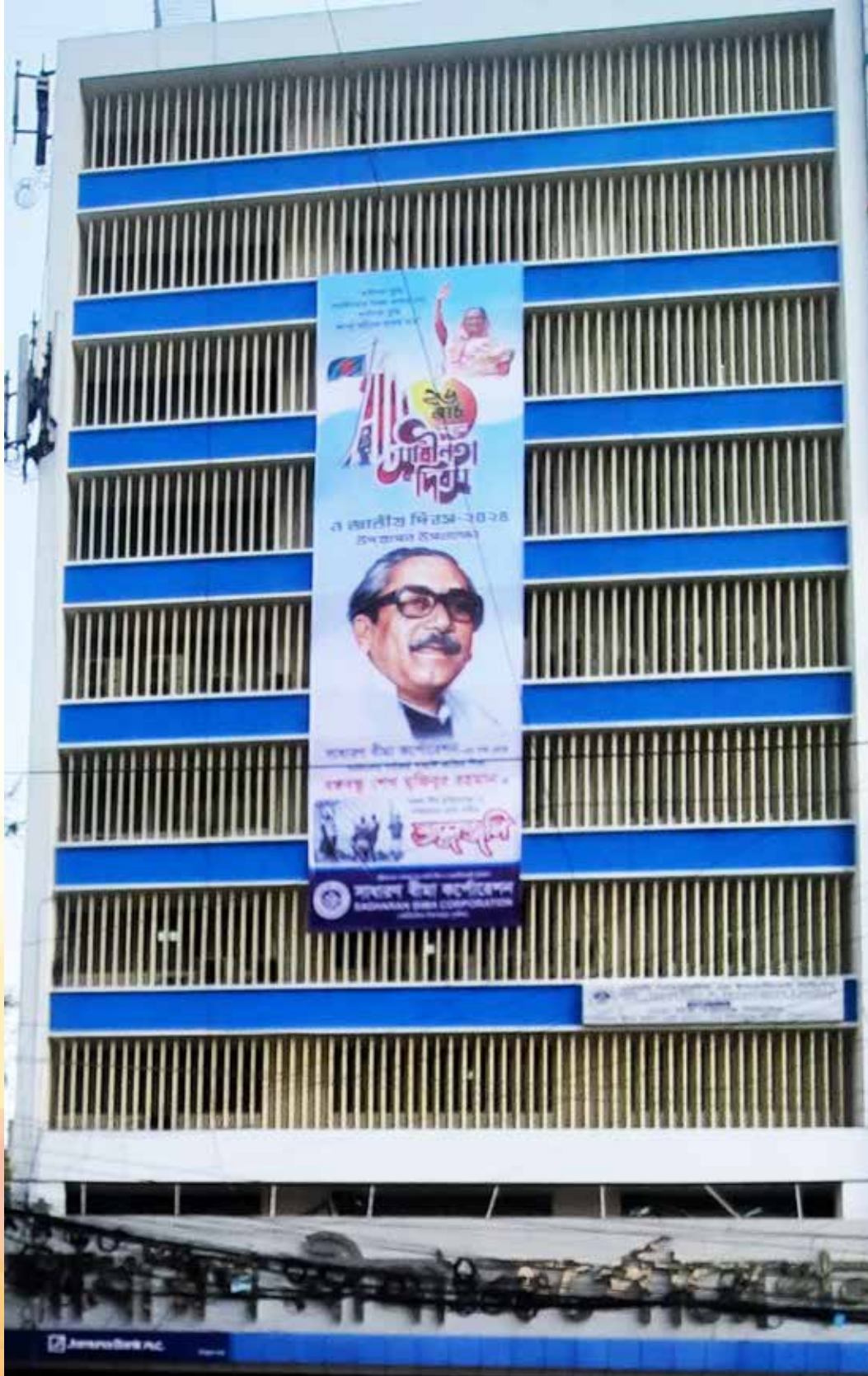
২৬ মার্চ ২০২৪ মহান স্বাধীনতা ও জাতীয় দিবস উদ্‌যাপন উপলক্ষ্যে সার্বিক, প্রধান কার্যালয়ে ড্রপ-ডাউন ব্যানার সাটানো হয়।