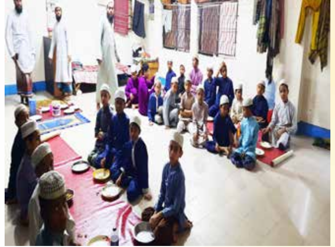
১৭ মার্চ জাতির পিতা বঙ্গবন্ধু শেখ মুজিবুর রহমান-এর জন্মদিন ও জাতীয় শিশু দিবস-২০২৪ উপলক্ষ্যে হাটখোলা রোড, টিকাটুলি, ঢাকা-এ অবস্থিত এতিমখানায় ইফতার বিতরণ করা হয়।