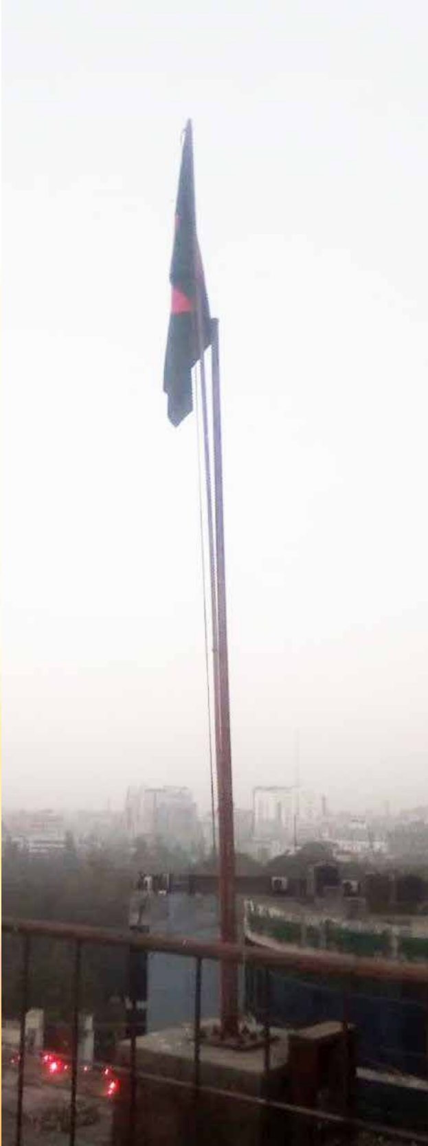
ঐতিহাসিক ৭ই মার্চ ২০২৪ উদ্যাপন উপলক্ষ্যে সাধারণ বীমা কর্পোরেশন, প্রধান কার্যালয়ে সূর্যোদয়ের সাথে সাথে 'দি ফ্ল্যাগ রুলস ১৯৭২' অনুসরণপূর্বক জাতীয় পতাকা উত্তোলন করা হয়।