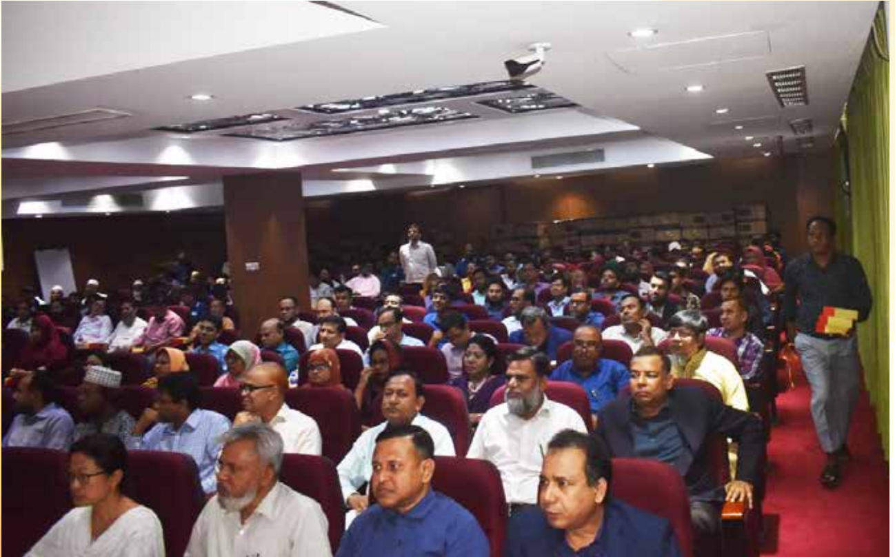
০১ মার্চ জাতীয় বীমা দিবস ২০২৪ আয়োজন উপলক্ষে ২৯/০২/২০২৪ তারিখে অভ্যন্তরীণ ট্রেনিং সেন্টার, সাধারণ বীমা কর্পোরেশনের প্রধান কার্যালয় এবং ঢাকা জোনাল অফিসের সকল কর্মকর্তা ও কর্মচারীগণকে প্রস্তুতিমূলক সভা করা হয়।