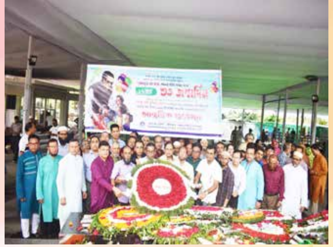
১৭ মার্চ জাতির পিতা বঙ্গবন্ধু শেখ মুজিবুর রহমান-এর জন্মদিন ও জাতীয় শিশু দিবস-২০২৪ উপলক্ষ্যে ধানমন্ডি ৩২ নম্বরে জাতির পিতা বঙ্গবন্ধু শেখ মুজিবুর রহমানের প্রতিকৃতিতে পুষ্পস্তবক অর্পণ করা হয়।