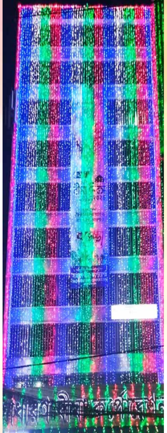
ঐতিহাসিক ৭ই মার্চ ২০২৪ উদ্যাপন উপলক্ষ্যে সাধারণ বীমা কর্পোরেশন, প্রধান কার্যালয়ে ০৬/০৩/২৪ তারিখ হতে ০৮/০৩/২৪ পর্যন্ত ০৩ (তিন) দিন ব্যাপী আলোকসজ্জায় সজ্জিতকরণ করা হয়।