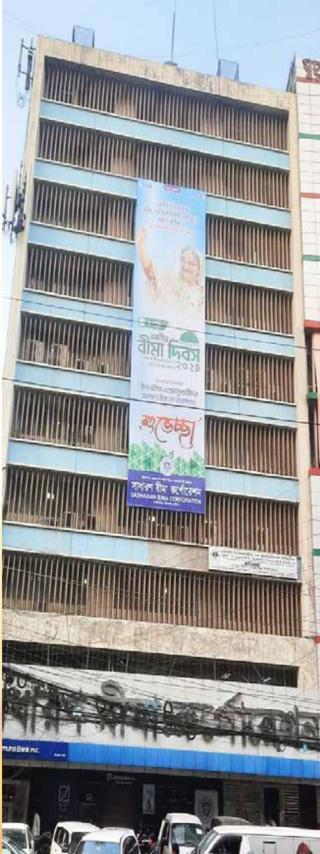
১ মার্চ জাতীয় বীমা দিবস ২০২৪ উদ্‌যাপন উপলক্ষে সাবীক, প্রধান কার্যালয়ে ড্রপ-ডাউন ব্যানার ও স্ট্যান্ড ব্যানার সাটানো হয়।